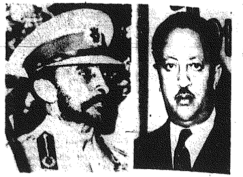
Po lewej - cesarz Etiopii Haile Selassie. Po prawej - jego syn, następca tronu, książę Asfa Wassan.

W piśmie okólnym zaleca się ministrowi handlu wewnętrznego sprawne zapoznanie ludności w okresie świątecznym, zaś ministrom komunikacji o