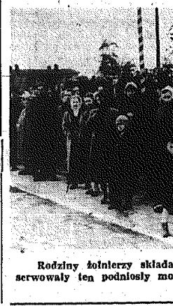
Rodzinny żołnierzy składających przysięgę z uwagą obserwowali ten podniosły moment.

MOSKWA P.A.P. W dniu 19 bm. na Kremlu rozpoczęło się zebranie aktywu moskiewskiej organizacji KPZR, poświęcone wynikom — narady przedstawicieli partii komunistycznych i robotniczych. Na zebraniu referat wygłosił członek prezydium i sekretarz KC PZPR, Frol Kozłow.