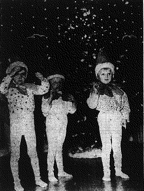
Rozpoczęły się już w przedszkolu tradycyjne, noworoczne zabawy przy choince...