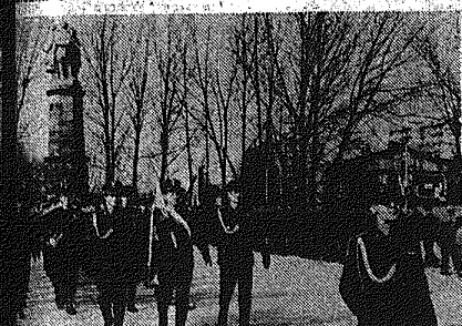
W uroczystościach związanych z 35. rocznicą zwycięstwa nad nazistami w Kielcu i Radomiu. W tle: Kłosa i Kłosa. W pierwszym rzędzie: Kłosa i Kłosa.