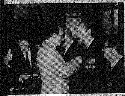
W uroczystościach związanych z 35. rocznicą zwycięstwa nad nazistami w Kielcu i Radomiu. W tle: Kłosa i Kłosa. W pierwszym rzędzie: Kłosa i Kłosa.

W uroczystościach związanych z 35. rocznicą zwycięstwa nad nazistami w Kielcu i Radomiu.