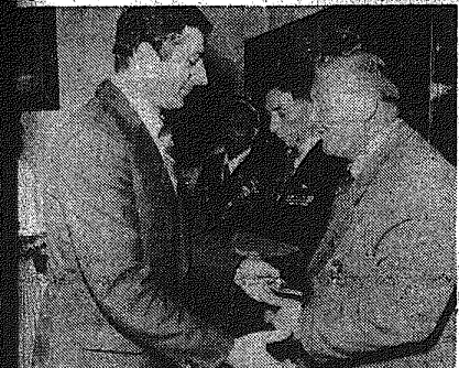
W uroczystościach związanych z 35. rocznicą zwycięstwa nad nazistami w Kielcu i Radomiu. W tle: Kłosa i Kłosa. W pierwszym rzędzie: Kłosa i Kłosa.