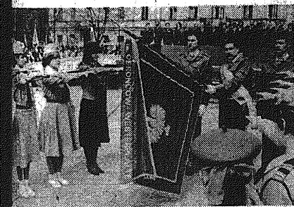
W uroczystościach związanych z 35. rocznicą zwycięstwa nad nazistami w Kielcu i Radomiu. W tle: Kłosa i Kłosa. W pierwszym rzędzie: Kłosa i Kłosa.