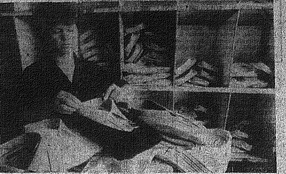
Na zdjęciu w zakładach „Wólczanka” w Ostrowcu Świętokrzyskim.