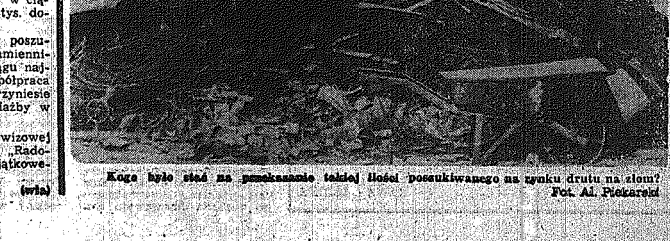
Kogo było siedzieć na przekazaniu takiej ilości posekowanego surowca drutu na strom?