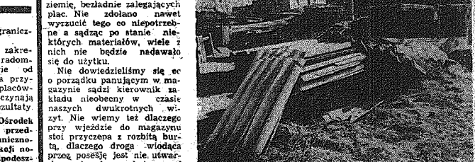
Nie do wiary, że tym bałaganem ktoś zawiaduje