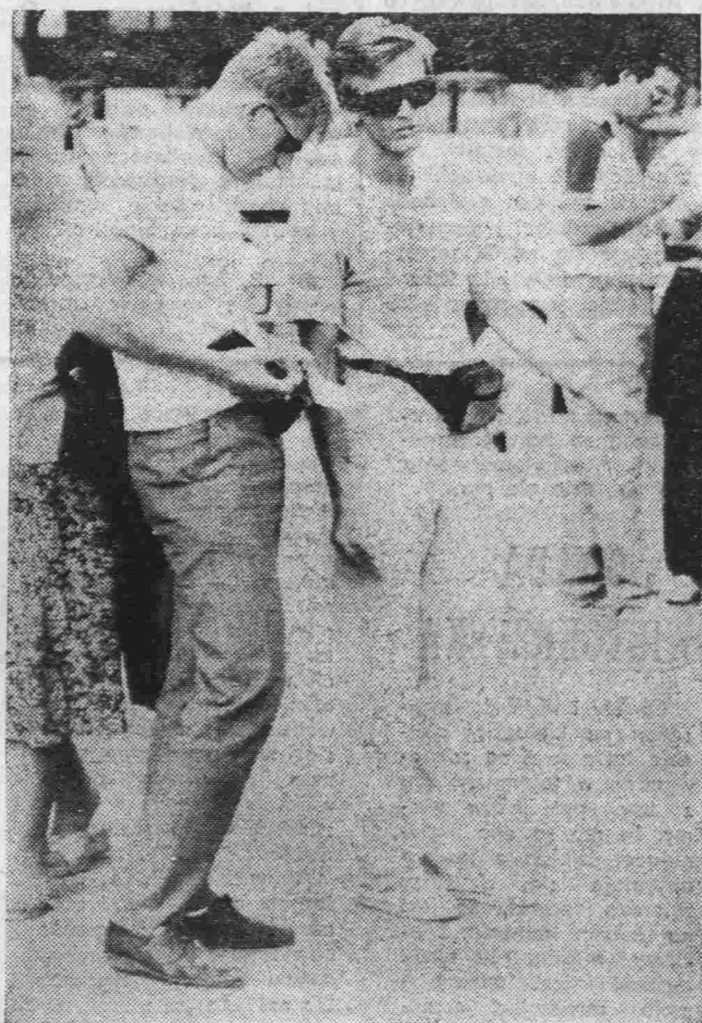
„COS KUPIC, SPRZEDAĆ?”. Bazar na Gwardii Ludowej.

Po burzliwej dyskusji nad formułą organizacyjną przyjęto następujące stanowisko: „wychodząc z przesłanek, wynikających z artykułu 10 ustawy o samorządzie terytorialnym i nie znajdując stosownej podstawy prawnej w obowiązujących przepisach (słownictwo, związek komunalny), zebrani w Poznaniu przedstawiciele samorządów miast polskich postanawiają utworzyć Związek Miast Polskich.