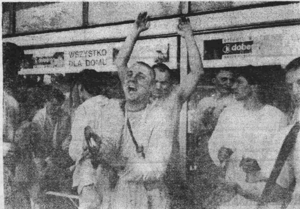
Bhaktowie z ich mistrzem duchowym Suhotrą Swami Maharają.