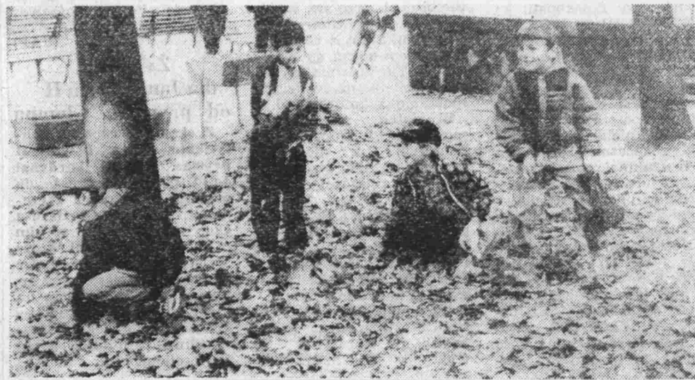
Jesień w kieleckim parku.