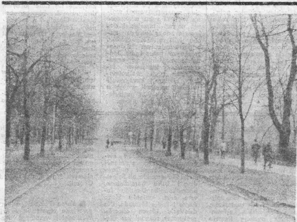
Na głównej ulicy Buska Zdroju.