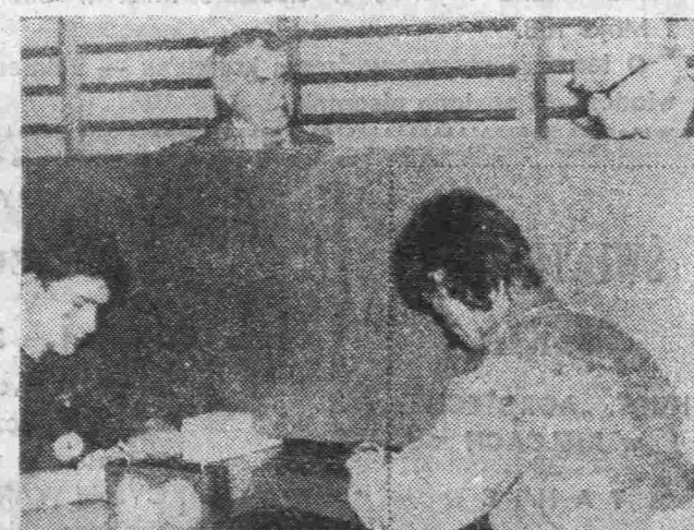
Już w najbliższy piątek kieleckich szachistów oczekują emocje podczas turnieju noworocznego organizowanego przez działaczy Kolejarza.

Impreza odbywa się dziś, o godzinie 13 w siedzibie Automobilklubu przy ul. Chęcińskiej 1 w Kielcach. Zainteresowane osoby proszone są o osobisty kontakt z organizatorami lub telefoniczny pod nr 66-07-10. (lb)