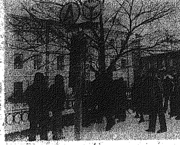
Zalobnie pasażerowie dlugo czekali na przystankach...