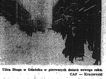
Ulica Długa w Gdańsku w pierwszych dniach nowego roku.

W trosce o najmłodszych Liczne przedsięwzięcia z okazji Międzynarodowego Roku Dziecka Z inicjatyw Narodów Zjednoczonych 1979 rok ogłoszony został Międzynarodowym Rokiem Dziecka i służić będzie pogłębieniu troski o rozwiązywanie problemów najmłodszych pokolenia, które stanowi ok. 1/3 całej ludzkości. Sprawy te w wielu krajach świata są jeszcze bardzo skomplikowane, w wielu podjęta ogromne wysiłki oraz tworzenia warunków skutecznego działania dla dobra najmłodszych. W Polsce oficjalne obchody Międzynarodowego Roku Dziecka rozpoczyna się w połowie stycznia br. Na inaugurację to nasz kraj przychodzi z konkretnym dużym dorobkiem. Troska o dobro dziecka i wychowanie młodego pokolenia DOKONCZENIE NA STR. 2