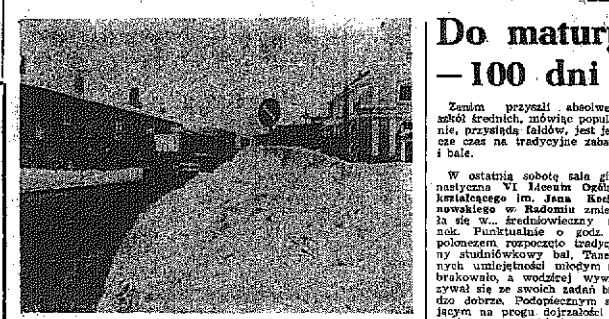
To zdjęcie wykonaliśmy na jednym z radomskich skryżowań... Wnieśliśmy do niego...