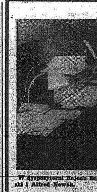
W Wytwórni Bielan Energetycznych Kielce Eugeniusz Zubawski i Alfred Nowak.

W mieście WSK, zbudowano do tej pory 100 samolotów AN-2. W tym czasie w innych częściach kraju zginęło 100.000. W tym czasie w innych częściach kraju zginęło 100.000. W tym czasie w innych częściach kraju zginęło 100.000.