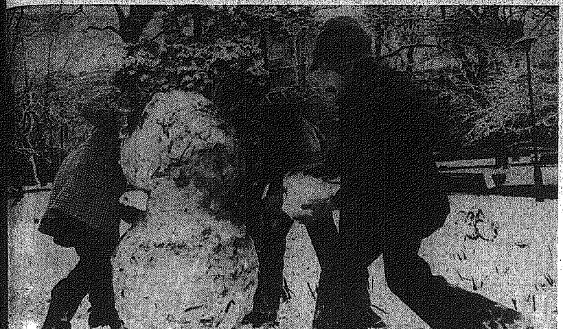
Dzieliom zima nie straszna...