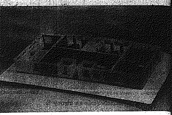
Fragment wnętrza

Ważnym problemem jest w tym czasie, aby nie stracił kontaktu z odbiorcą... Nie, nie wymagam od pana takiej deklaracji... Rozmawiał i notował STANISŁAW MIJAS