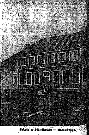
Bakała w Józefówce — stan obecny