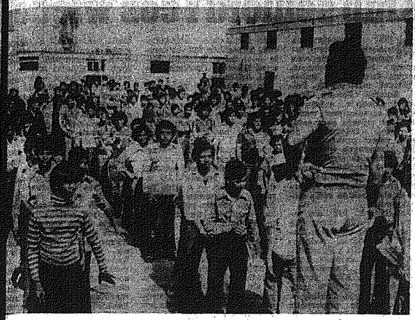
Jordania. Obóz uchodźców palestyńskich w Baka.