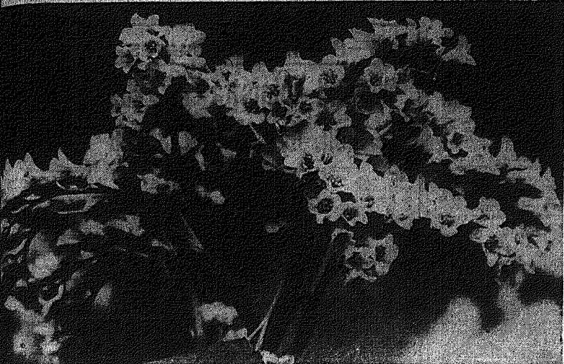
Kwitną wioseane kwiaty...