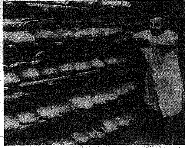
Okolo 4 ton pierzywa wywieka każdego dnia... Wymontujemy ponad 5 domów Rejonowego Przedsiębiorstwa Gospodarki Mieszkańczej...