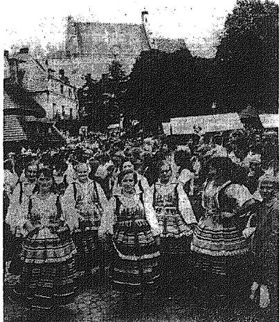
„Raz na ludowo”