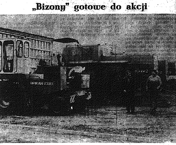
W Radomskiem już się rozpoczęła inwazja. Rolnicy na razie używają do sprzętu cięższych maszyn — żniwiarzy i wiatraków.

Ważny wzrost plonów w 50-80 procentach zależy od nawożenia, a to w 20-30 proc. od innych czynników takich jak właściwa agrotechnika.