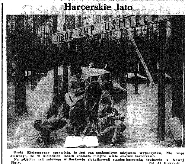
Uroki Kieleccyzy sprawują, że jest ona znakomitym miejscem wypoczynku. Nie wieje dziwno, w kieleckich lasach znalazło się miejsce dla młodzieży harcerskiej. Na zdjęciu: nad zalewem w Borkowie zlokalizowali stanicę harcerską drabnowie z Nowej Hut.