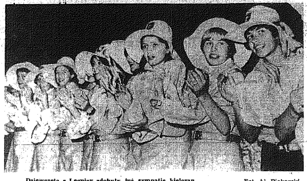
Dziewczęta z Legnicy zdobyły już sympatię kielczan.

Pelesza Jaroszewicza premiera Indii Rady Ministrów Jaroszewicz wystosował gratulacyjną do prezydenta Republiki Indii Charana Singha z okazji objęcia przez niego tego urzędu. VI Harcerski Festiwal Kultury i Podzieży Szkolnej