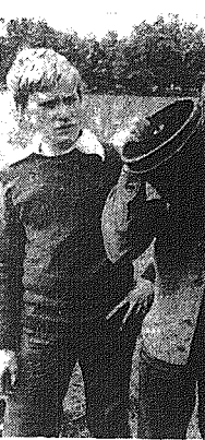
CAF — Undro

Nad Jeziorem Radca rozbił swoje namioty członkowie Klubu Młodych Astronomów Koszalińskiego Towarzystwa Społeczno-Kulturalnego. W sumie na obozie przebywa 23 uczniów szkół podstawowych i średnich. Młodzież obserwuje Słońce, Księżyc, sztuczne satelity, meteoroidy itp. zawiąski, a obok kółek specjalistycznych, jak to na obozie — ognisko, woda, wypoczynek, gry i zabawy. Na zjeździe: młodsi milocnicy astronomii obserwują Słońce.