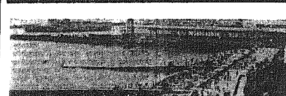
Na plaży w Soczi