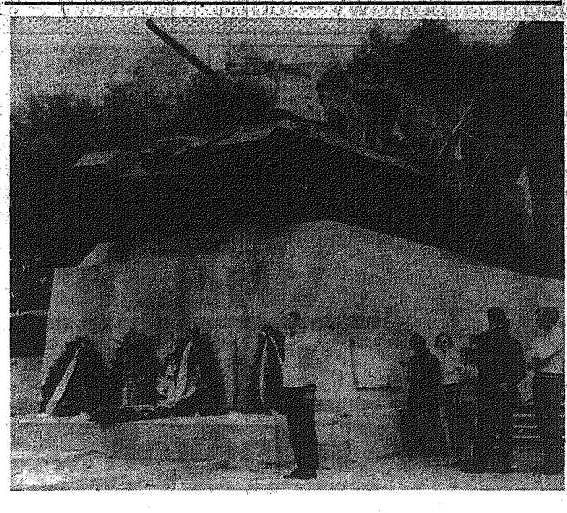
Na zdjęciu: Studzianka — pomnik-mauzoleum.

NA SPOKOJNEJ, rozległej nizinie ciągnęła się woda, między Pilicą a Radomką, na której tegoroczne zima przekroczyła swój półmetek, nie dając nam wskazywać, że 35 lat temu rozegrała się tu jedna z największych bitew pancernych ostatniej wojny.