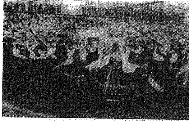
Widowisko dożynkowe na stadionie 35-lecia PRL w Piotrkowie Trybunalskim.

Dziękując pracowitości i gospodarności rolników wspartej wszechstronną pomocą państwa oraz konsekwentnej realizacji postanowień XV plenum KC PZPR i przyjętego na tym plenum rządowego programu przeciwdziałania skutkom długo-