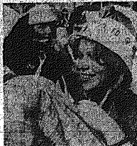
To zdjęcie upokorne zostało podczas studenckich juwenaliów. Z pewnością wiele podobnych par spotkamy na wielkiej dyskusji...