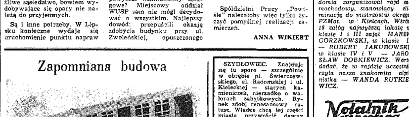
Zdjęcie zostało zrobione w tym roku, w ostatnich dniach...

Renowacja zabytkowych kamieniczek W ratuszu - Pałac Ślubów