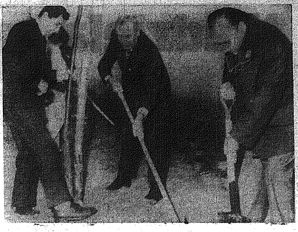
Na terenie ogrodu botanicznego w Powoniu w Warszawie pracował I sekretarz KC PZPR Edward Gierek.