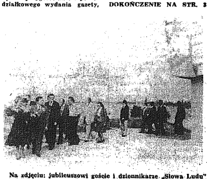
Na zdjęciu: jubileuszowi gości i dziennikarze „Słowa Ludu” składają kwiaty pod pomnikiem na Kadzieli.

30 lat minęło... Wczoraj wspólną pracą normalną socjalistyczną robotą nad przygotowaniem niedzielnego wydania gazety, wstąpiło „Słowo Ludu” w drugie trzydziścielecie. Skończył się jubileusz, zespół redakcyjny, drukarze, kolportery. DOKONCZENIE NA STR. 3