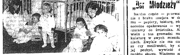
W złożku przy ul. Osiedlowej w Radomiu.