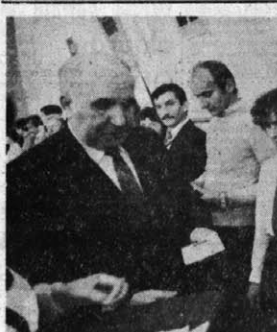
Dia nich to wielkie przeżycie, przed chwilą otrzymali legitymację kandydacką