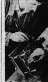
Od ubiegłego roku działają w Zakładach Wytwarzających Magnetyt... (z)

Symbolicznego otwarcia szesnastu przepliwanych sosnowy bal — dokonał autor... (z)