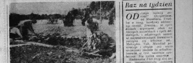
Wzrost lepszego nie przeszkodzi... W tym celu organizatorzy, ogrodnicy, w tym celu organizatorzy, ogrodnicy...