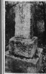
W jakim mieście wole- wadzisz (dla ułatwienia na literę K) znajduje się ten pomnik: pod pomnikiem Fryderyka Chopina?