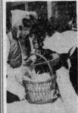
Gdy Czerwony Kaktuski wypielę: dlaczego nasz imię wzięło ocy, babciu? — wiadomości Przeglądu Dziecięcego Zespołu Teatralnych i Lalkowych przedstawień przy klubach pracy i książki zdala sobie sprawy, że za chwilę mogą nie dotrzeć rzeczy straszne, których niecierpi Andrzej Mieczko nie wymyślił...