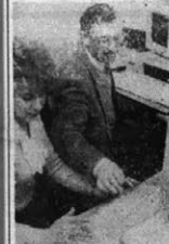
Fotoreporterzy radzi: dyktatorze, jeśli już konieczne musisz mieć to swoje firmowe kompiuter, zabój przynajmniej o odpowiedzialność w razie zniszczenia towaroznawcy.