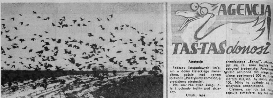
...dlatego, że paszkowały nawet na głowy urzędników...