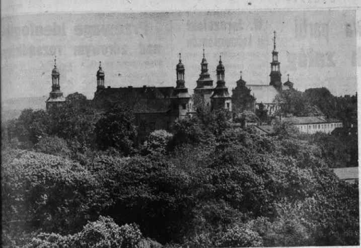
Wzgórze Zamkowe w Kielecach.