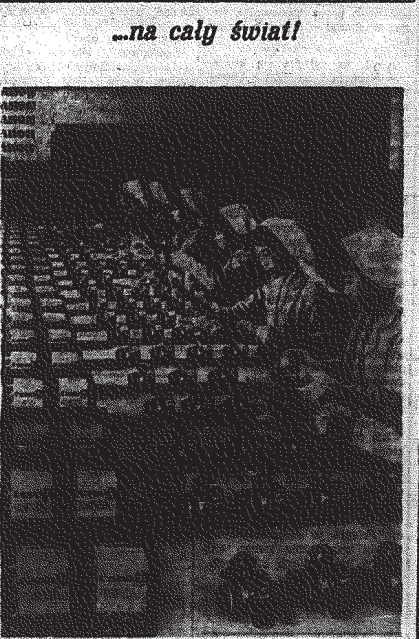
Fakowna w masnej krowatce fabrycy aparatów fotograficznych "Canon" w Tolda, której wylęgi są obsługiwane na cały świat.