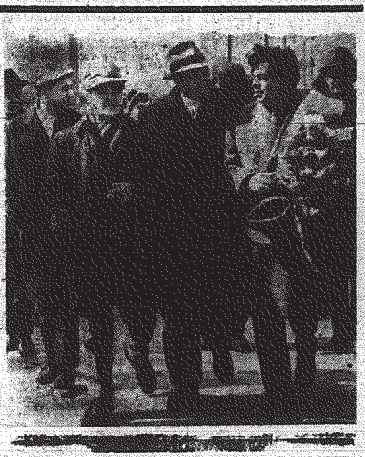
Rajkin w Warszawie 4 bm. przybył do Polski szaryn jut w naszym kraju Leningradzki Teatr Minister kierowany przez Arkadego Rajkina. Na zdjęciu: powitanie na Dworcu Gdańskim w Warszawie