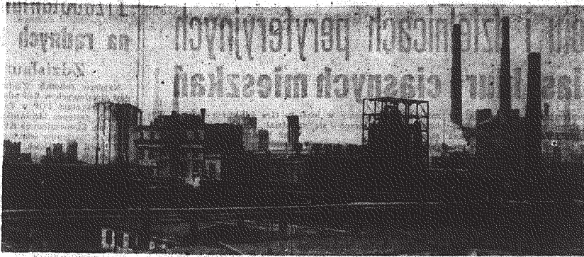
Ponad 23,6 miliarda zł przeznaczamy w latach 1961 - 1965 na inwestycje w hutnictwie. Sama tylko huta im. Lenina osiągnie w 1963 r. 3,5 miliona ton stali, to jest dwa razy więcej niż wszystkie huty w Polsce przed wojną. Na zdjęciu: fragment kombinatu hutniczego im. Lenina w Nowej Hucie.