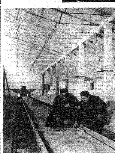
Na terenie woj. bydgoskiego wybuduje się w bieżącym roku sześć nowoczesnych obór...