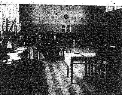
Eliminacje odbyły się w sali gimnastycznej, w głębi - zwycięzka drużyna Technikum Chemicznego z Kielca.