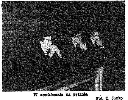
W oczekiwaniu na pytanie.

Zwycięską drużyną w grupie udział w eliminacjach ogólnopolskich w Warszawie, (4)