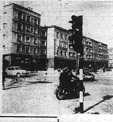
To nie Warszawa, to nasze Kielce, fragment ul. Bużka.