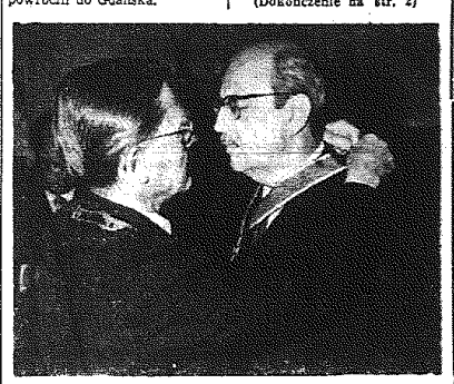
Przewodniczący Rady Państwa PRL Aleksander Zawadzki uderował w dniu 15 maja 1982 r. w Belwederze w Warszawie, przebywającego z oficjalną wizytą w Polsce, ministra spraw zagranicznych Brazylii dr Francisco Clementino de San Tiago Dantas. Krzyżem Komandorskim z Gwiazdą Orderu Odrodzenia Polski A. Zawadzki zaś uderowany został przez min. Dantas — Wielkim Krzyżem Orderu Narodowego „Kryśja Polodnia”. Na zdjęciu: Aleksander Zawadzki dekoruje dr Dantas.