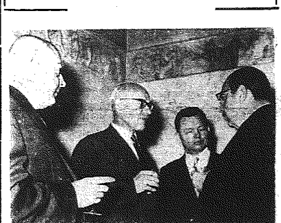
W dniu 15. V. 82 r. premier Józef Cyrankiewicz wydadł oświadczenie na temat wizyty w Warszawie, przebywającego z oficjalną wizytą w Polsce, ministra spraw zagranicznych Brazylii dr Francisco Clementino de San Tiago Dantas. Na zdjęciu: premier J. Cyrankiewicz, I sekretarz KC PZPR Wł. Gomułka, tłumacz, wln. spow. zagranicznych Brazylii dr F. C. de San Tiago Dantas.