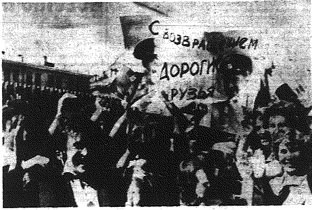
Ludność Moskwy powitała entuzjastycznie wiadomość o lądowaniu kosmonautów Andriana Nikołajewa i Pawła Popowicza. Na zdjęciu: witające tłumy na Placu Czerwonym.

W ŚRODĘ późnym wieczorem, zgodnie z oczekiwaniami, nastąpiło w siedzibie ONZ w obecności sekretarza generalnego U Thanta uroczyste podpisanie porozumienia przekazującego Indonezji administrację nad Irianem Zachodnim. Ze strony indonezyjskiej umowę podpisał minister spraw zagranicznych dr Subandrio, ze strony holenderskiej - amb. Van Roijen.