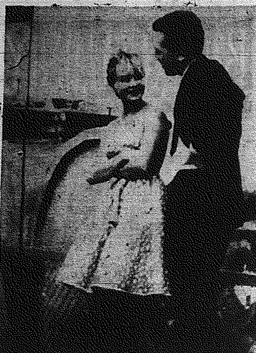
Scena ze scen filmu.