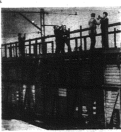
Na stacji kolejowej w Koninie trwają prace przy przebudowie torów, rozjazdów i przewodów oraz roboty przy regulacji elektrycznej sieci trakcyjnej. Wszystkie prace wykonywane są bez wstrzymywania lub ograniczenia ruchu pociągów.

W roku 1964 zaplanowane jest uruchomienie nowej stacji radiowo - telewizyjnej na Św. Krzyżu. Moc nadajnika telewizyjnego wynosić będzie 100 kW. Już obecnie na Św. Krzyżu nadchodzi transporty części nowego nadajnika TV z Czechosłowacji.