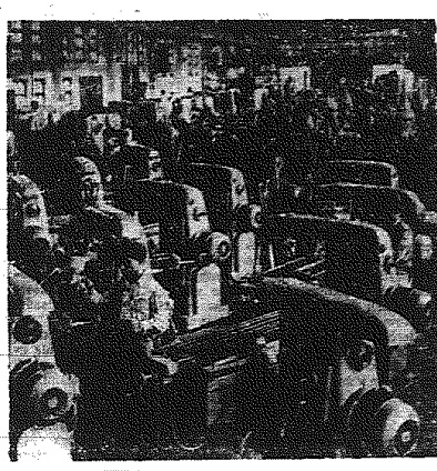
Jedna z hal fabryki budowy maszyn w Hielchu w KRH.D. W ciągu ubiegłego półroczia zbudowano 179 traktorów...