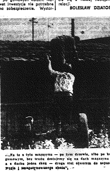
„To za to żył magazyn - po tym drzewie, albo po kole gumowym, bez trudu dostajemy się na dach magazynu...”