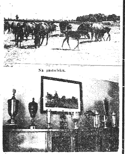
Fragment kolekcji wozów i statków przemyślanych za zwycięstwa w wyszczególnionych miejscach.