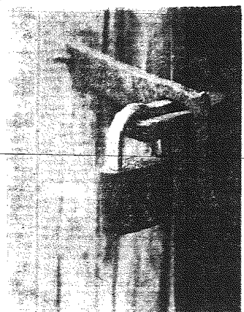
„Jest magazyn - a jakże, od strony arcy powtarzamy” - Mikołaj na bramie wjazdowej.