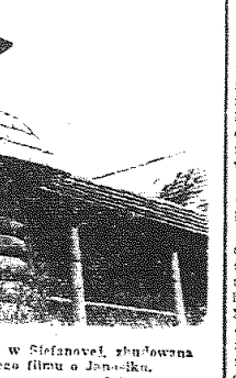
Kateřka 'Pod Przepiękłą' w Sifanowcu, zbudowana w Katowicach z kreconym nowocześnie Janosik