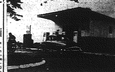
Nowa prowokacja NATO

PARYZ PAP. - We wtorek zakończyła się w Paryżu dwudniowa narada ministrów finansów sześciu krajów członkowskich Wspólnego Ryнку. Nie podjęto żadnych decyzji dotyczących planowanej wspólnie inflacji, pomocy krajom afrykańskim oraz koordynacji polityki budżetowej poszczególnych krajów członkowskich.