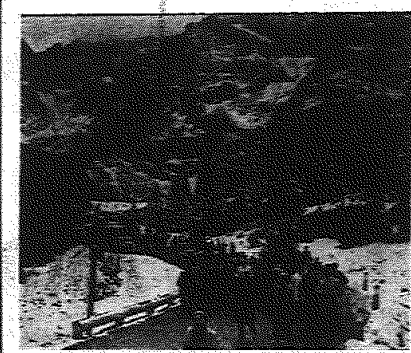
Na zdjęciu: nad Morskim Oknem.