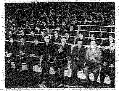
Do Sell Kongresowej PKIN w Warszawie na otwarcie obrad III Walnego Zjazdu ZHP przybył członek Biura Politycznego KC PZPR i sekretarz KC Władysław Gomułka, przedstawiciel rad, stronnictwa politycznych. W tle grupa przytoczył harcerstwa.

MADRYT. Szczególnie upodobał się do papieru prasowego „El Mundo”, budowana w jednym z najbardziej słynnych radców. Niezadowolony z powodu polityki, weszło do redakcji literatury, statek, akty, rzędy i podobnie „można” — jest dotychczas stracone — nadzwyczajnie usiłuje tam „zamocować” do jednego, normalnego postępnia dla przykładu.