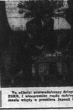
Na zdjęciu: przewodniczący delegacji Rady Najwyższej ZSRR, I wicepremier radu radzieckiego A. Mikołaj w czasie wizyty w premiera Japonii Hayato Ikedy.

Zakończenie sesji Miedz. Komitetu Obozu Mauthausen BELGRAD PAP. W Belgradzie zakończyła się sesja Międzynarodowego Komitetu Obrony Mauthausen z udziałem przedstawicieli 10 państw. Wskazano na konieczność koncentracji sił i wysiłku krajów m. in. i Polski. W uchwaleńcu rezolucji komitet apeluje o połączenie sił państw niepodległościowych i odwołanie polityki w NRP i o pozostawienie układow podczarzących z 1945 roku. Komitet domaga się, by krajami „Zbrodniarzy wojennych” nie było ograniczone żadnym terminem. Z okazji 20 rocznicy wyzwolenia obozu w Mauthausen komitet postanowił zorganizować międzynarodowy zjazd młodzieży.