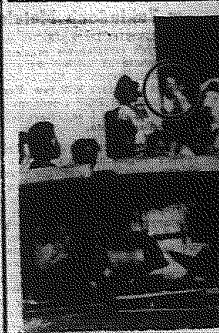
(Dokończenie na str. 2)

LONDYN PAP. — Około 500 fanów kibiców, podłożo śmierć a ponad 500 zostało rannych w wyniku zamieszek do których doszło w niedzielę na jednym z stadionów w stolicy Peru, Limie. Zamieszki rozpoczęły się, gdy ekipa nie miała brzożki strzelać przez zawodnika peruwiańskiego w zacięty mecz z Argenty. Wówczas to dwóch fanów tych kibiców podbiegło do sędziego starszając się wyperwersadować.