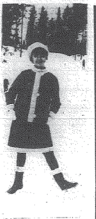
Flakka moda znowa. Kostium z demembrasowego zamysłu, lamowany błoną barankiem, z którego zrobiona jest czapka i rekawiczki.

Przyjmując, że w tym zakresie jest konieczne, aby przeliczenia i kalkulacje były zgodne z rzeczywistością, a nie z teorią. W tym zakresie jest konieczne, aby przeliczenia i kalkulacje były zgodne z rzeczywistością, a nie z teorią.