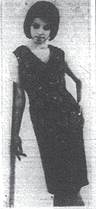
„Jedna zima z Dom Mody” - Jedna zima z Dom Mody „Jedna zima z Dom Mody” - Jedna zima z Dom Mody