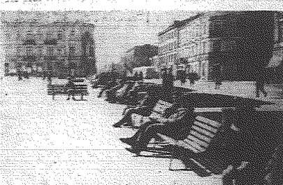
Słoneczny i ciepły był dzień przedwczesny. Nic też dziwnego, że ławki na Placu Obrotów Stalingradu były zajęte.