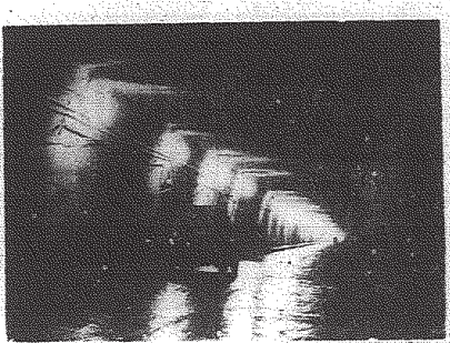
Dwie doliny Kirtgyl — Czajka i Susamyrka położone są na wysokości ponad 2500 metrów n.p.m. i rozdziela je wysoka pasmo Gór Kirgiskich...