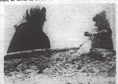
Pod oknem babki, pierwsze babki z plakau.