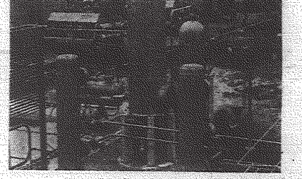
Na zdjęciu: aparatura do tłoczenia powietrza i gazu.

Nastąpiła E. Szyr odpowiadał na pytania dziennikarzy.