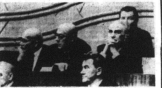
Władysław Gomułka, Józef Cyrankiewicz i Luigi Longo w Prezydium XXIII Zjazdu KPZR.