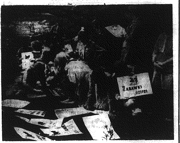
Teoretyczne obozy odbywały się pod znakiem Milenium, co znajduje wyraz zarówno w pogadankach przy tradycyjnym ognisku harcerskim, jak i w innych zajęciach obozowych. Na zdjęciu: młodzież na obozie harcerskim w pow. nowotarskim podczas zajęć plastycznych.