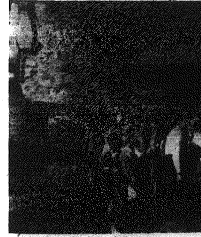
Trende „Dni Folkloru Świętokrzyskiego”... Folklor świętokrzyski