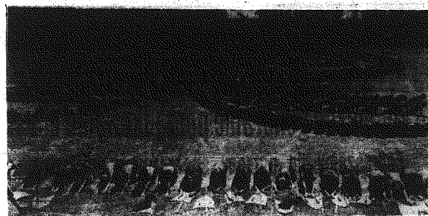
W stołey trwały intensywne przygotowania do centralnych uroczystości... W stołey trwały intensywne przygotowania do centralnych uroczystości

na niezbędnych materiałach... Felieton Kooperacyjna łamigłówka