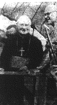
W czasie światła Bożego Narodzenia kardynał Spellman przebywał wśród amerykańskich ofiar wojny w Wietnamie, wyrażając opinie, która oburzająca cały świat.

Te wojnę — oświadczył on, im — USA prowadzą w imię cywilizacji, bo są „samarytanami narodów”. Do grudnia ubiegłego roku jedna tona cementu kosztowała 56 złotych. 2 grudnia Państwowa Komisja Cen podjęła decyzję o obniżce cen cementu budowlanego i cementu portlandzkiego do marki 250 do 460 złotych za tonę. Nowe ceny, szczególnie kozytne dla robotników, którym niepodręczny jest do niskiego budownictwa wiejskiego cement wyżej jakości, obowiązują od 6 grudnia do 15 stycznia br. Od 16 stycznia cement znów kosztować będzie drożej, za jedną tonę trzeba będzie zapłacić 600 złotych. Śluzne zarządzenie przyniosło oczekiwane rezultaty, gdyż w pierwszej połowie grudnia rotacyjnie Kielecczyzna kupił 4 tysiące ton cementu, a w drugiej połowie miesiąca, mimo przypływu nowych zamówień, wyprodukowała aż 8 tysięcy ton. Zmniejszyły się rezerwy cementu w magazynach, lecz w dalszym ciągu handel wietnamski ma tam 25 tysiące ton tego materiału. Dzieje się tak między innymi dlatego, że nie wszystkie rezerwy wojennej, które sprzedają przebiega równomiernie. Stosunkowo dobrze rozumieją swój interes rolnicy z powiatu zwoleńskiego, nato-