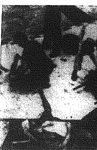
Wielka operacja wojsk USA w rejonie delty Mekongu, uchroniona na krótko. „Deckhouse V” nie krył spodziewanych rezultatów. Desanty interwentów amerykańskich nie nawiałły koniunktury wojennej z partyzantami. Ale ofiar nie brak. Wskutek eksplozji granatu ranną na ziemi helikoptera desantowa, startująca z lotniska „Two Jims”. Zabrała helikoptera i zainicjowała wari na pokład lotniskowca.

nikowice, rannik kapitana i zabijając jednego z członków załogi, oraz dwa polowicze min, z których jeden został uszkodzony i musiano go doholować do portu. Nieco dalej na południe, w Delcie rzeki Mekong, partyzanci zatopili amerykańską postębiarkę czwartą co do wielkości na świecie. Po raz trzeci w ciągu ostatnich 48 godzin patroli południowowietnamscy ostrzelali wczoraj nad ranem obozem z moździerzy amerykański oboz wojskowy i lotnisko Holo- (Dokończenie na str. 2)