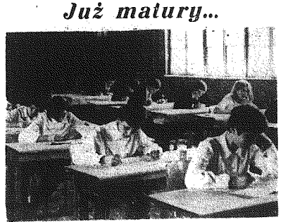
Matura odbywa się w szkolnej świetlicy.

Wzrosty wykrycie gruźlicy warunkiem szybkiego powrotu do zdrowia. Wzrosty wykrycie gruźlicy warunkiem szybkiego powrotu do zdrowia.