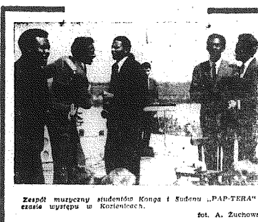
Zespół muzyczny studentów Konga i Sudanu „PAP-TERA” w czasie występu w Koźminach.

ostatnio robił w kraju dużą furorę. Black-outi mają też własnych braci interesujących solistów.